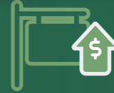
Tabela değeri yüksek yerler

Hedef kitlenin yoğun olduğu yerler (Üniversite öğrencileri ve etnik nüfus)