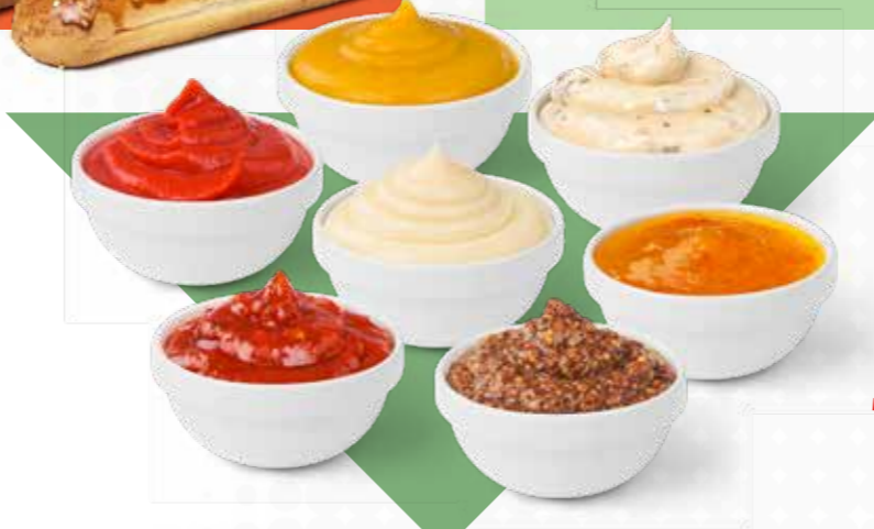
Sos Çeşitliliği ve Lezzeti