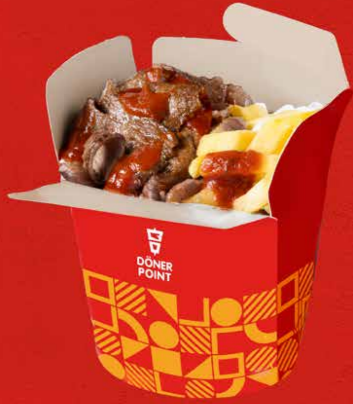
DÖNER PATATES BOX