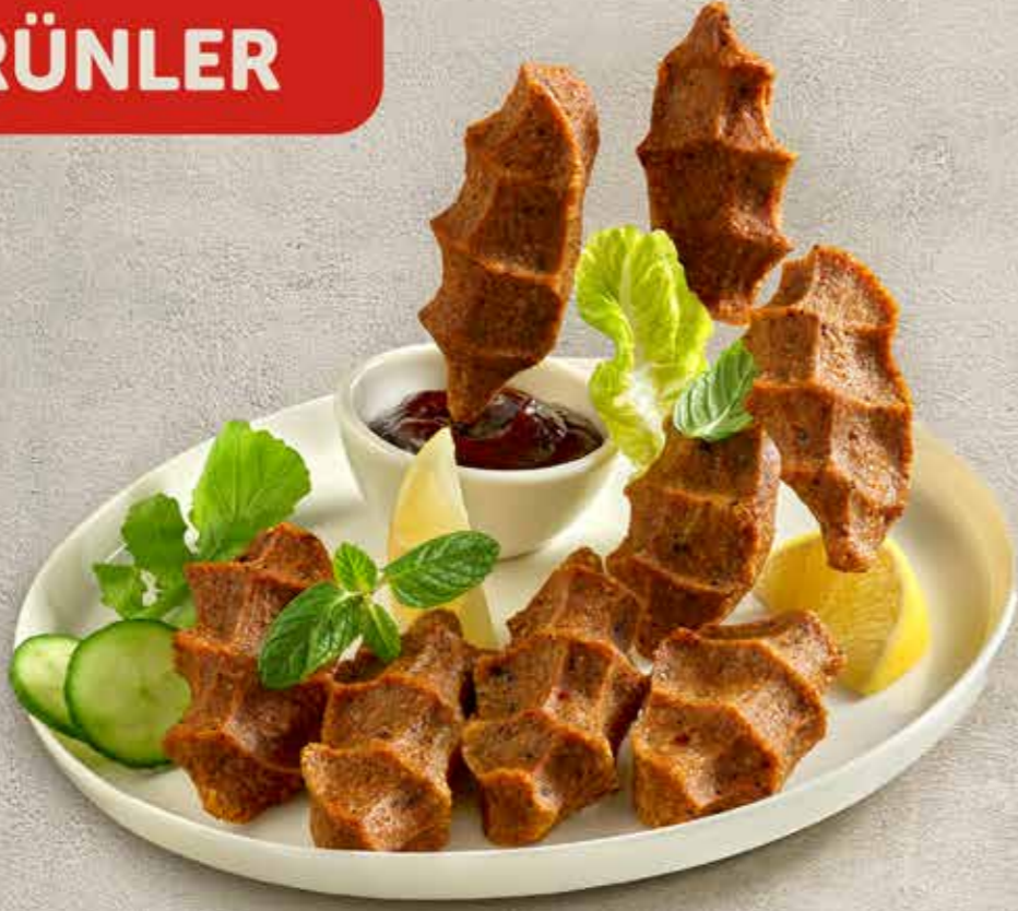
ÇİĞ KÖFTE PORSİYON by komagene