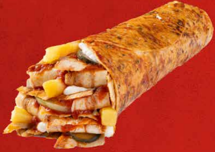
ÖZEL SOSLU TAVUK DÜRÜM