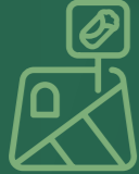
Tabela görünürlüğü yüksek yerler